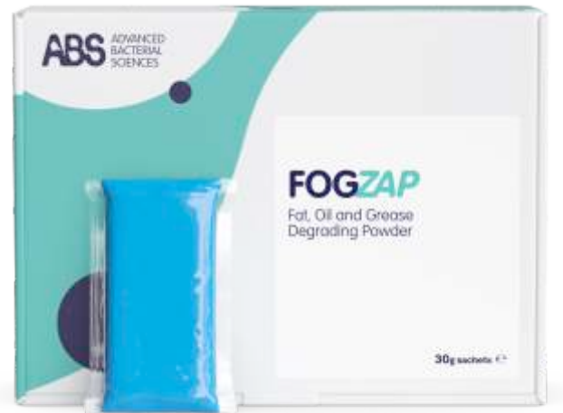
Inainte de FOGZAP

*) FOGS = FAT, OIL, GREASES = GRĂSIMI ȘI ULEIURI